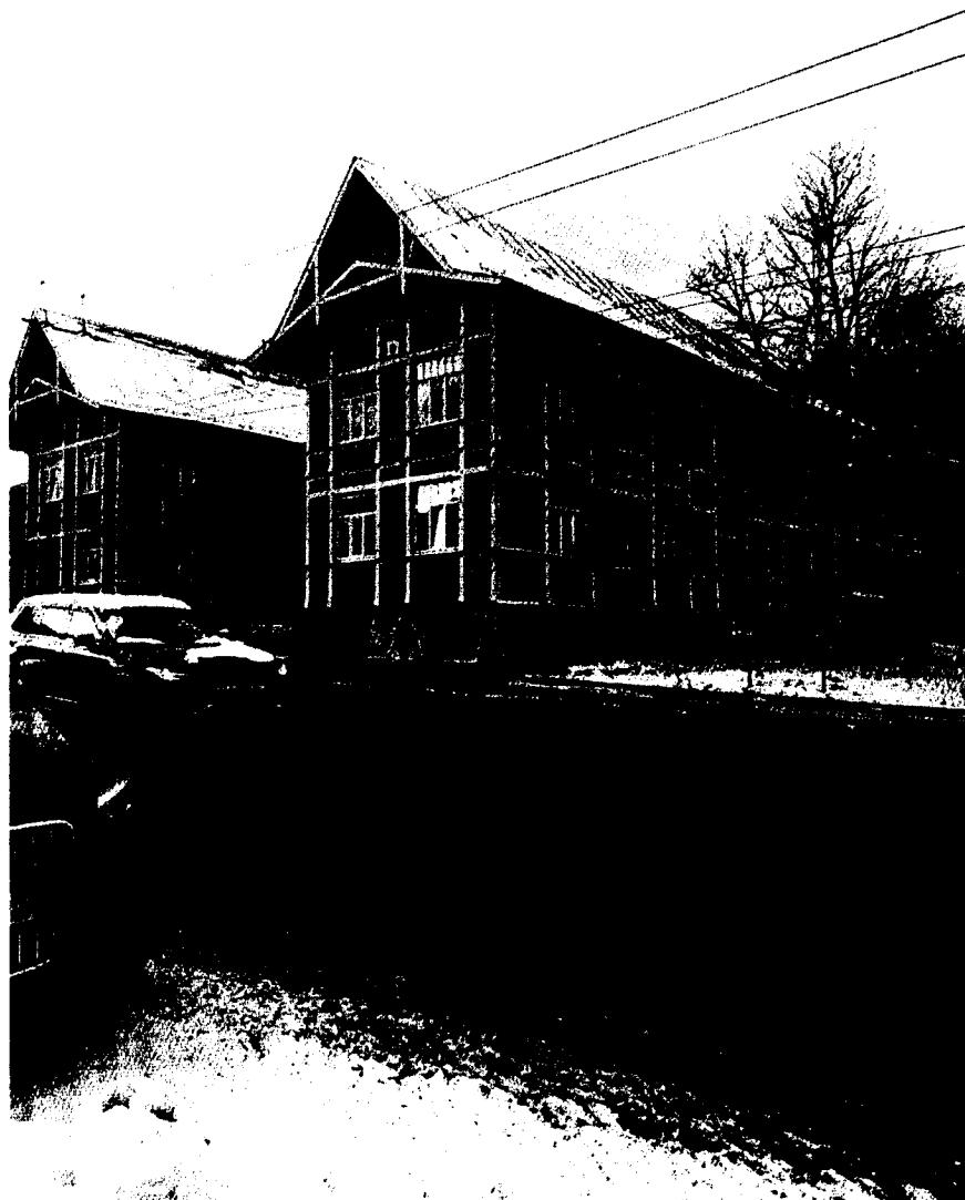
«Здание административное» Республика Карелия, г. Петрозаводск, пр. Ленина, д. 22-а Общий вид с юго-востока Дата: 29.10.2019