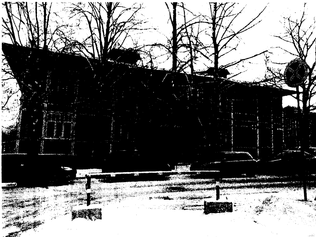
«Здание административное» Республика Карелия, г. Петрозаводск, пр. Ленина, д. 22-а Вид на дворовой фасад с северо-запада Дата: 29.10.2019