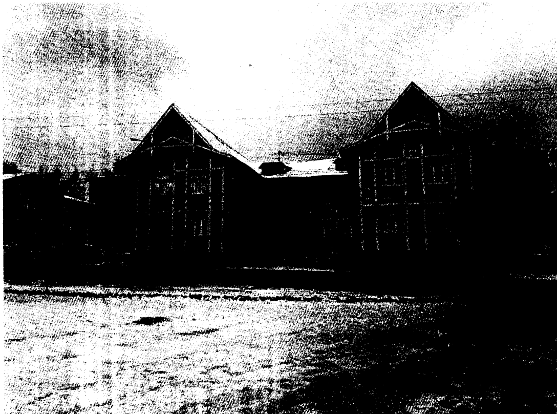
«Здание административное» Республика Карелия, г. Петрозаводск, пр. Ленина, д. 22-а Вид на фасад со стороны просп. Ленина Дата: 29.10.2019