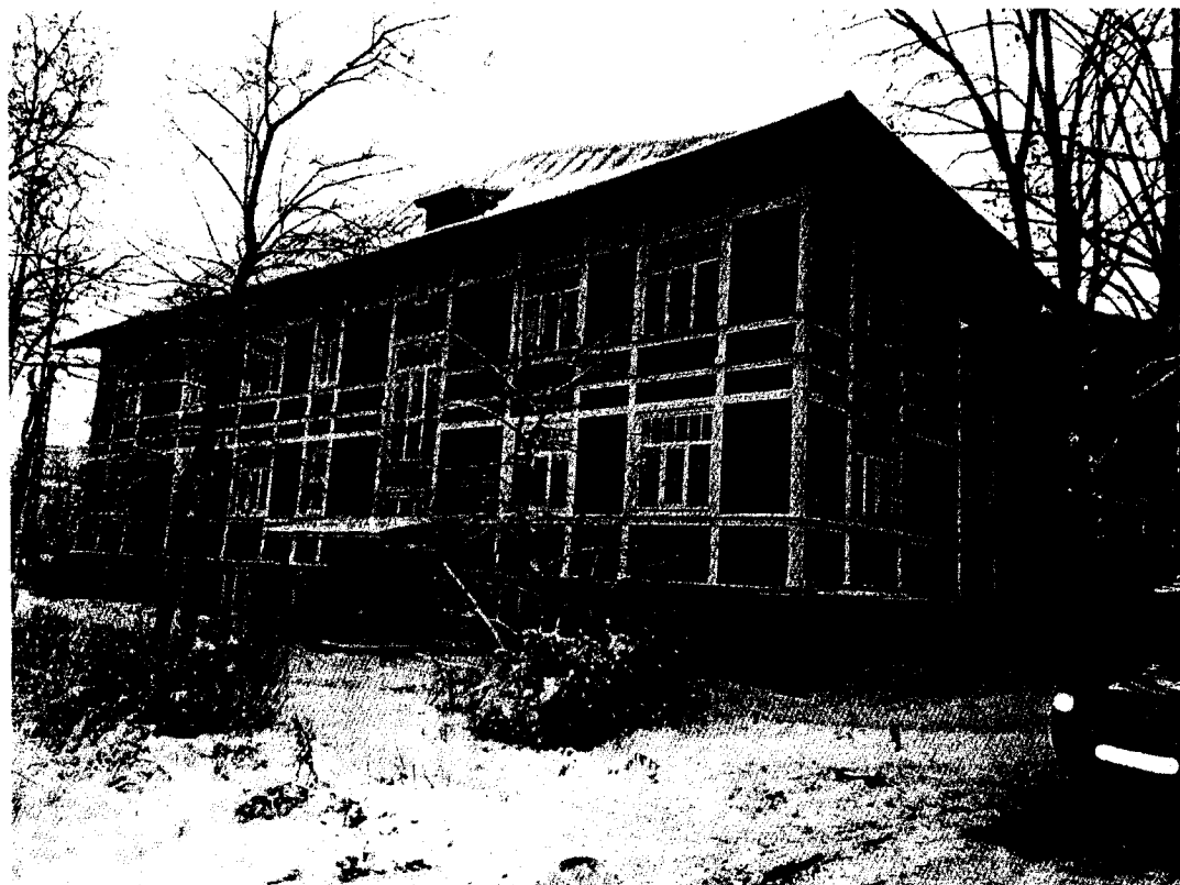
«Здание административное» Республика Карелия, г. Петрозаводск, пр. Ленина, д. 22-а Общий вид с севера Дата: 29.10.2019