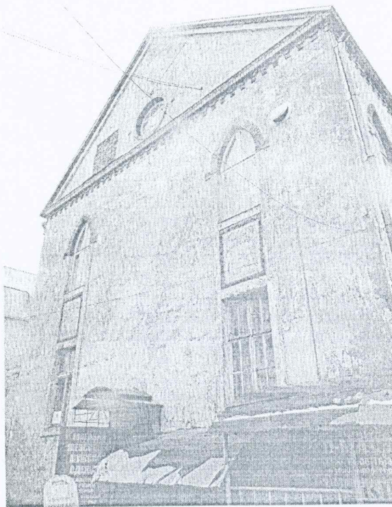
«Здание издательства религиозной литературы (кирпичное)» Республика Карелия, г. Сортавала, ул. Карельская, д. 42 Фрагмент бокового фасада Дата: 23.09.2014